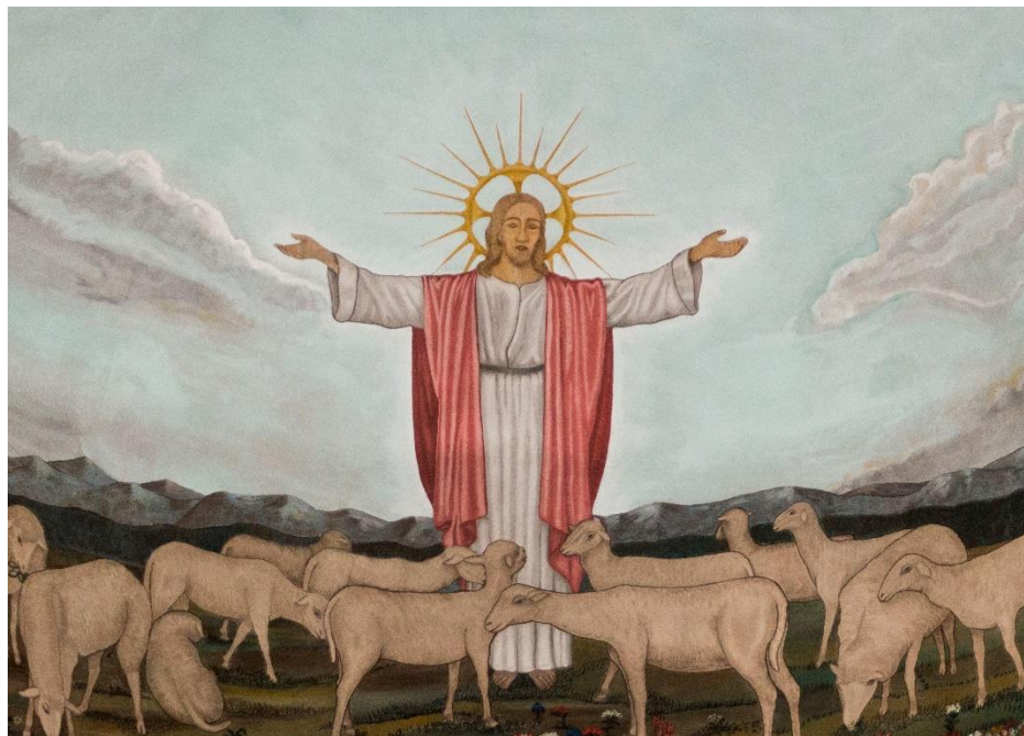
Chiesa di Tezze sul Brenta

«Andiamo e lasciamoci sorprendere da quest'alba diversa, lasciamoci sorprendere dalla novità che solo Cristo può dare. Lasciamo che la sua tenerezza e il suo amore muovano i nostri passi, lasciamo che il battito del suo cuore trasformi il nostro debole palpito».