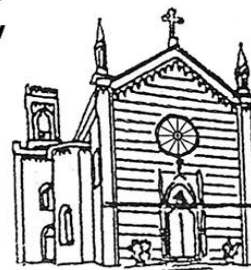
BELVEDERE Sacro Cuore di Gesù