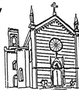
BELVEDERE Sacro Cuore di Gesù