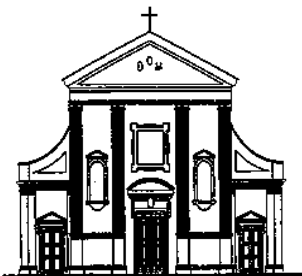
TEZZE SUL BRENTA Santi Pietro e Rocco