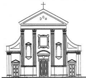
TEZZE SUL BRENTA Santi Pietro e Rocco