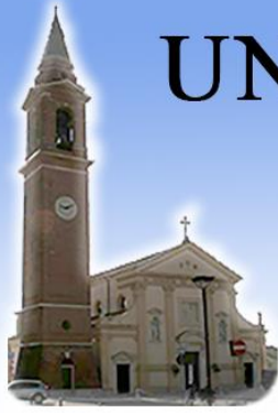
TEZZE SUL BRENTA Santi Pietro e Rocco