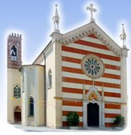
BELVEDERE Sacro Cuore di Gesù