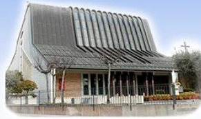
STROPPARI Beata Vergine Maria Madonna della Salute