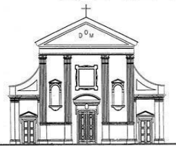
TEZZE SUL BRENTA Santi Pietro e Rocco